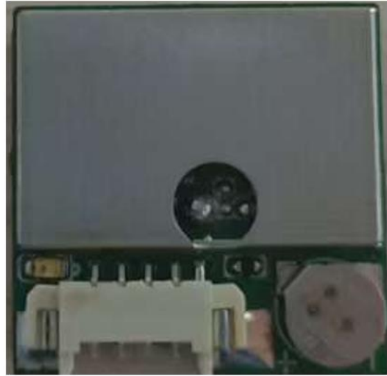
GND RX TX 5V 1PPS